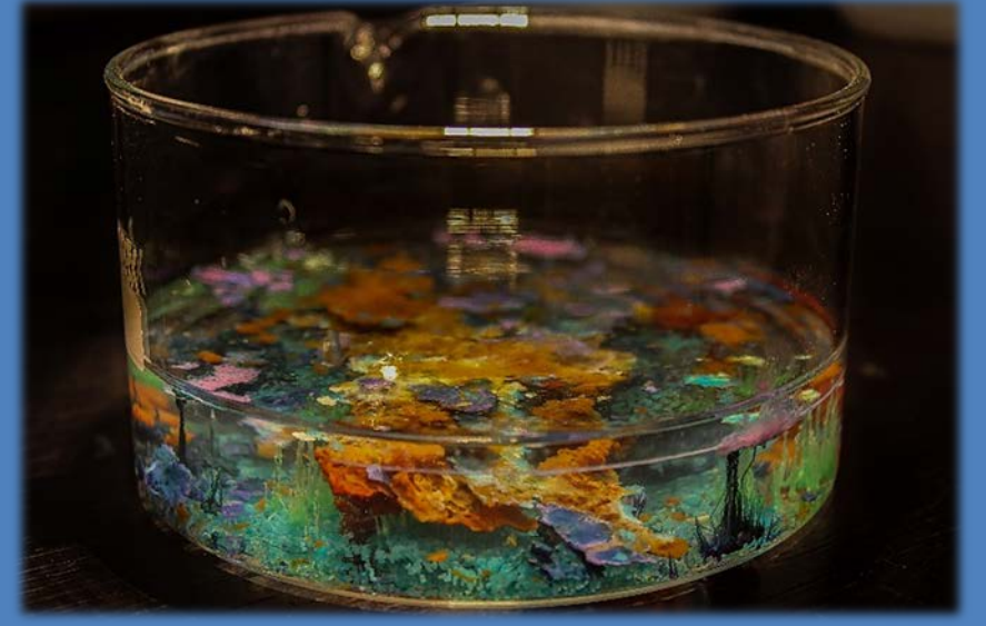
Foto: "Océano químico" Autora: Laura Sánchez (1º Premio ano 2019)

Premios: entrega o 16 de novembro a partir das 13:15 h